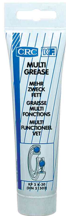
Mehrzweckfett "MULTI GREASE"