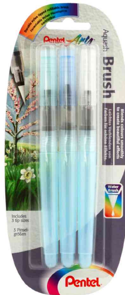
Aquash Pinselstift, 3er Set