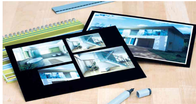
Hochglanz-Etiketten SPECIAL, Anwendung