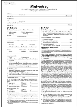
Mietvertrag mit Hausordnung