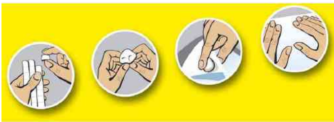
abziehen - kneten - anbringen - fixieren