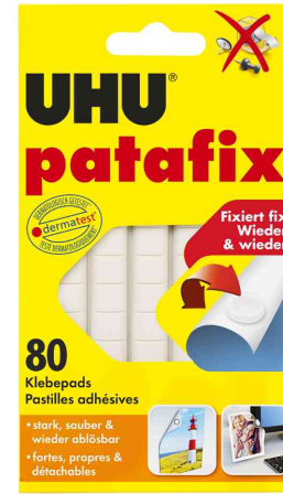
Klebe pads patafix, weiß