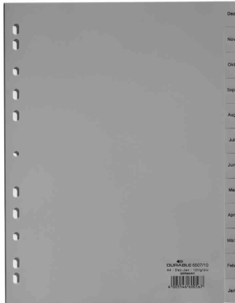
Monate Kunststoff-Register, Dezember - Januar