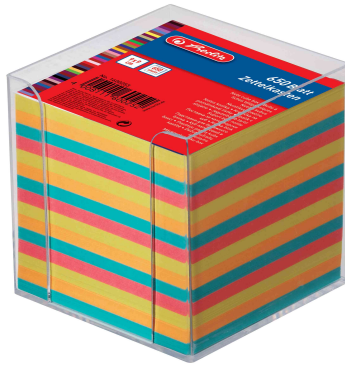
Zettelbox transparent, Papier farbig