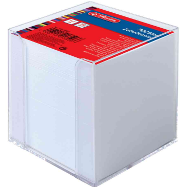
Zettelbox transparent, Papier weiß