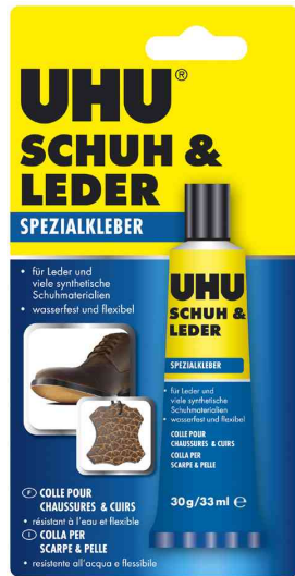
Spezialkleber SCHUH &amp; LEDER