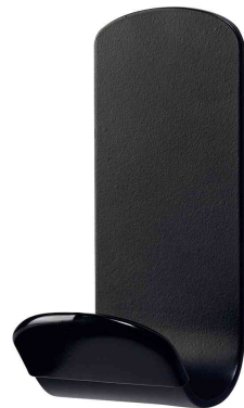
Garderobenhaken "STEELY", schwarz