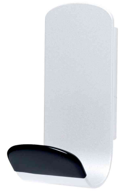
Garderobenhaken "STEELY", weiß / schwarz