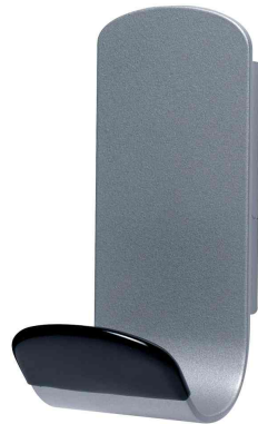
Garderobenhaken "STEELY", metallic-grau / schwarz