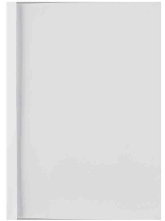
Thermo-Bindemappe ThermoBind Business Line Lederstruktur, weiß