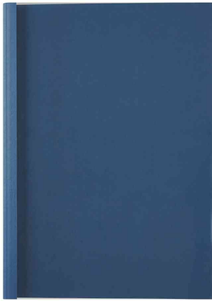
Thermo-Bindemappe ThermoBind Business Line Lederstruktur, dunkelblau