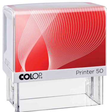
Text-Stempelautomat Printer 50

Info: Alle konfigurierbaren Stempel liefern wir bereits ab einer Bestellung von 1 Stück Frei Haus! Bitte beachten Sie, dass konfigurierbare Stempel immer in einem separaten Auftrag ausgeführt werden!