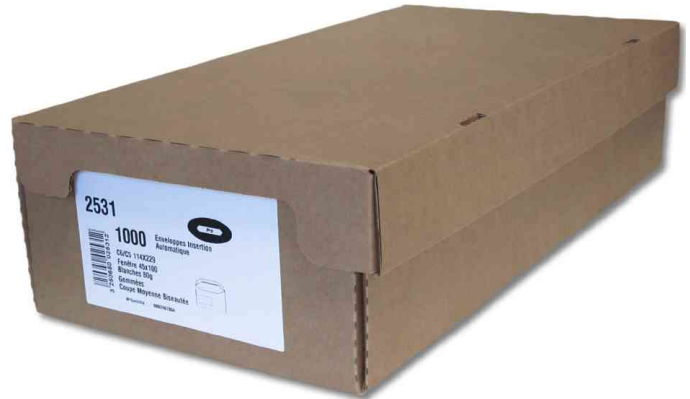
Symbolbid: Briefumschläge, Karton