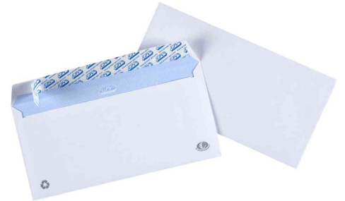
Symbolbid: Briefumschläge, Großpackungen