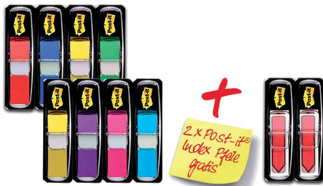
Haftmarker Index Mini, Vorteilspack