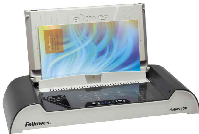
Thermobindergerät Helios 30