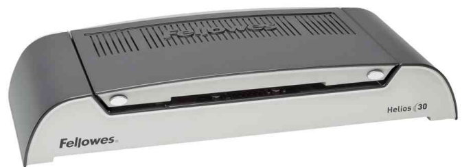
Thermobindergerät Helios 30, geschlossen