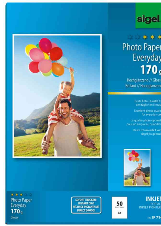
Inkjet-Foto-Papier "Everyday", 170 g/qm, 50 Blatt