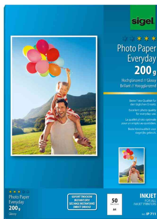
Inkjet-Foto-Papier "Everyday", 200 g/qm, 50 Blatt