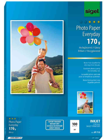
Inkjet-Foto-Papier "Everyday", 170 g/qm, 100 Blatt