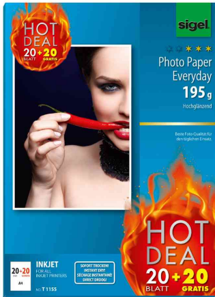
Inkjet-Foto-Papier "Everyday" "HOT DEAL"