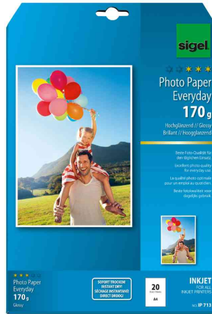
Inkjet-Foto-Papier "Everyday", 170 g/qm, 20 Blatt