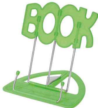
Leseständer BOOK, grün