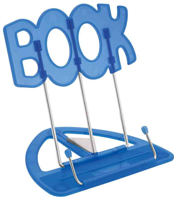
Leseständer BOOK, blau