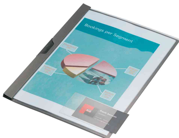
Selbstklebetaschen POCKETFIX®, Anwendungsbeispiel