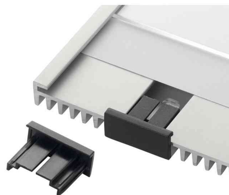
Zubehör: INFO SIGN Kappen