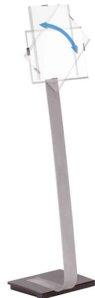
Drehbar in Hoch- und Querformat