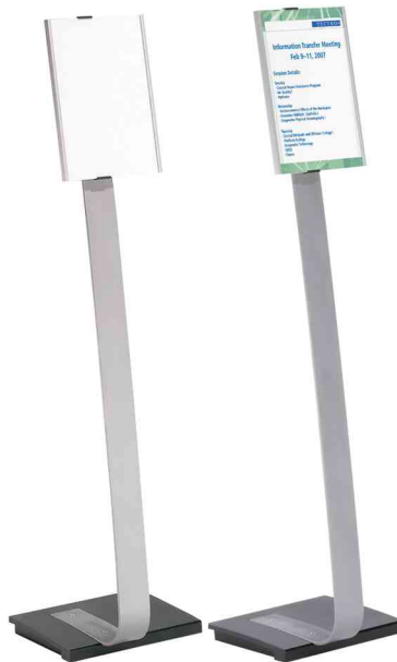
Infoständer INFO SIGN stand, Hochformat