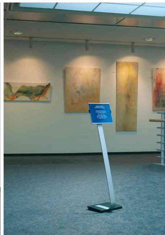
Anwendungsbeispiel: Infoständer INFO SIGN stand