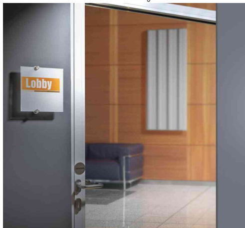
Türschild CRYSTAL SIGN, Anwendungsbeispiel