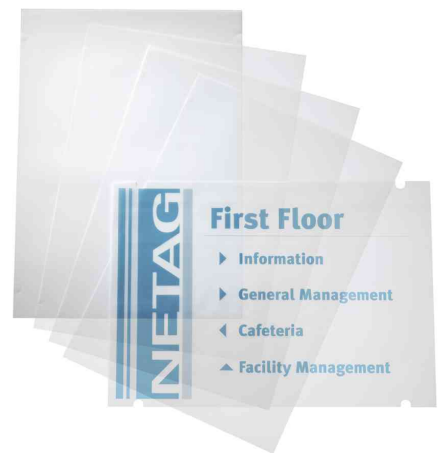
Zubehör: Folien CRYSTAL SIGN refill