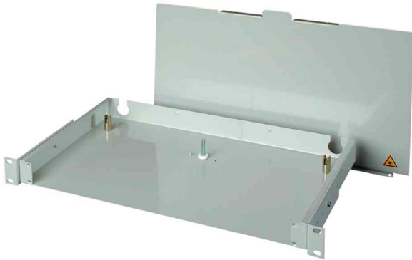
Patch Panel - Basis V