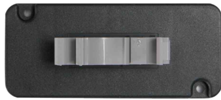
Einzelmodul Kat.7A(tief), mit Hutschienenadapter