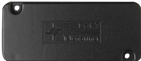
Einzelmodul, Kat.7A(tief), anschraubbar