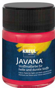
Textilfarbe JAVANA, 50 ml