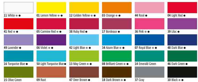
Textilfarbe JAVANA, Farben