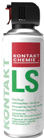
Leiterplattenspülung "KONTAKT LS"