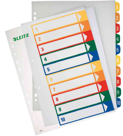
Zahlen Kunststoff-Register, 10-teilig