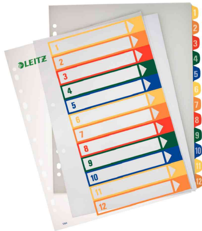
Zahlen Kunststoff-Register, 12-teilig