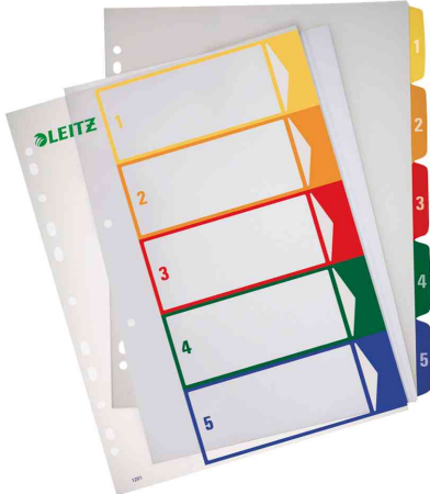
Zahlen Kunststoff-Register, 5-teilig

Hinweis: kostenlose Word-Formatvorlage steht unter www.leitz.com zum Download zur Verfügung