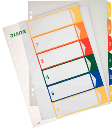
Zahlen Kunststoff-Register, 6-teilig