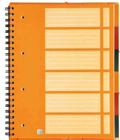
Indexblatt - 6 Taben zur Organisation