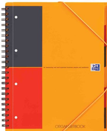
Collegeblock "ORGANISERBOOK", DIN A4+, liniert