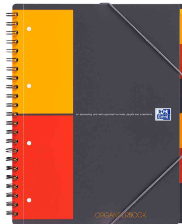
Collegeblock "ORGANISERBOOK", DIN A4+, liniert