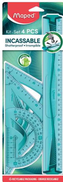
Geometrie-Set Maxi Flex