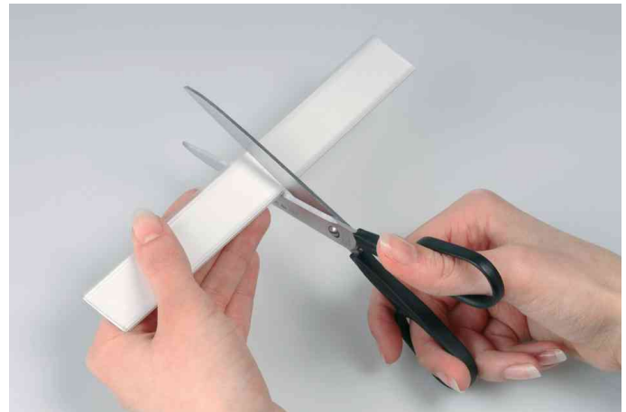
Können auf die gewünschte Breite zugeschnitten werden