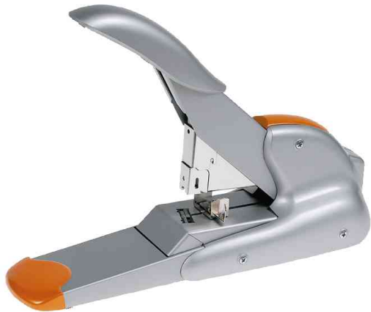
Blockheftgerät Supreme DUAX

- ideal, wenn unterschiedlich dicke Stapel Papier zu heften sind