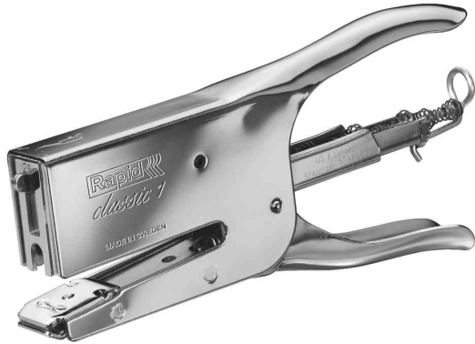
Heftzange Classic K1