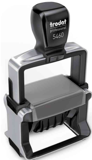
Datumstempel Professional 4.0 5460

Info: Alle konfigurierbaren Stempel liefern wir bereits ab einer Bestellung von 1 Stück Frei Haus! Bitte beachten Sie, dass konfigurierbare Stempel immer in einem separaten Auftrag ausgeführt werden!