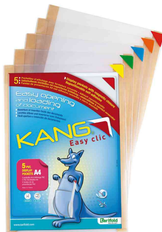
Magnet-Tasche "KANG Easy clic"