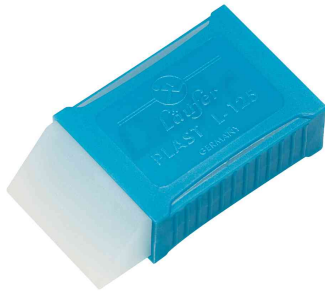
Kunststoff-Radierer PLAST L-125