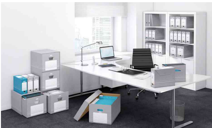
Zeigt die komplette Archivserie in Anwendung