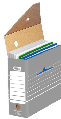
Archiv-Schachtel, (B)110 mm - Lieferung unbestückt