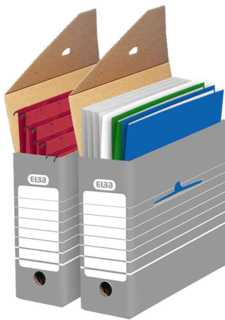
Archiv-Schachtel, (B)95 mm - Lieferung unbestückt