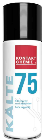
Kältespray "KÄLTE 75"