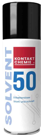
Etikettenlöser "SOLVENT 50"