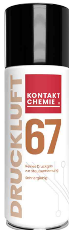
Druckluftreiniger "DRUCKLUFT 67"