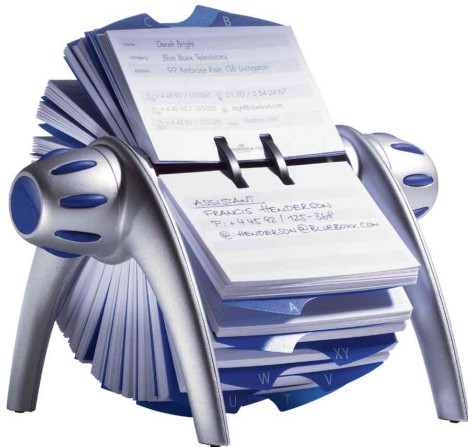
TELINDEX® flip Adresskartei, metallic-silber / blau