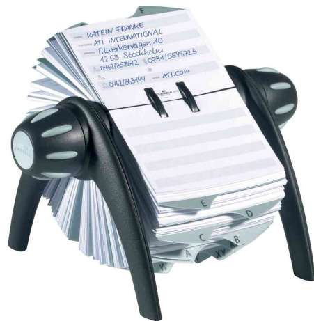
TELINDEX® flip Adresskartei, schwarz / grau