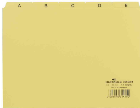
Karteiregister A - Z, gelb