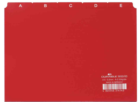
Karteiregister A - Z, rot