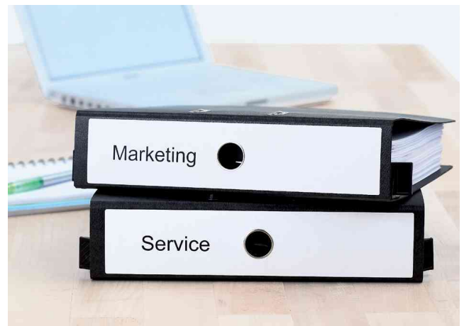
Orderrücken-Etiketten SPECIAL für Hängeordner, Anwendung