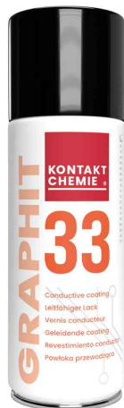
Grafit-Leitlack "GRAPHIT 33"