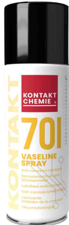
Schmiermittel "KONTAKT 701"