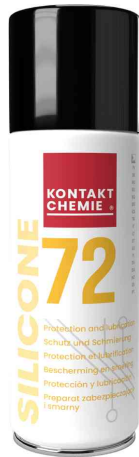
Silikonöl "SILICONE 72"