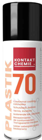
Schutz- und Isolierlack "PLASTIK 70"