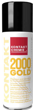
Kontaktschmierstoff "KONTAKT GOLD 2000"