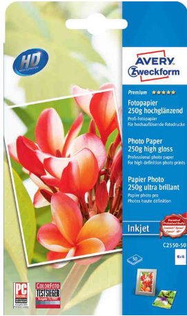
Inkjet-Foto-Papier, im Endformat (50 Blatt)

- ideal für Portraits, Nahaufnahmen und hochwertige Fotodrucke