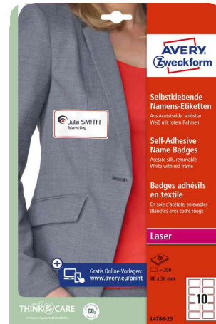
Namensetiketten, mit rotem Rahmen